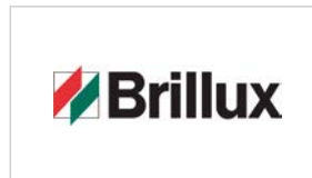
Brillux GmbH & Co. KG www.brillux.de