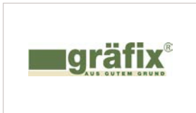
Wolfgang Endress Kalk- und Schotterwerk GmbH & Co. KG www.graefix.de