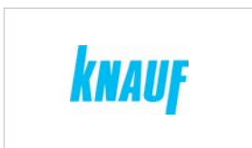
KNAUF Gips KG www.knauf.de