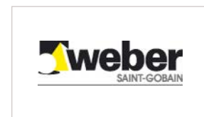
Saint-Gobain Weber GmbH www.sg-weber.de