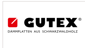
GUTEX Holzfaserplattenwerk www.gutex.de