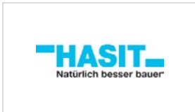
HASIT Trockenmörtel GmbH www.hasit.de