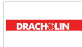
DRACHOLIN GmbH www.dracholin.de