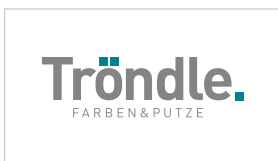
Tröndle Edelputz GmbH www.troendleputz.de